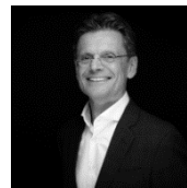
JAN WILLEM SCHENK

De UBO-registers zijn een Europese database en is in Nederland onderdeel van de Wet ter voorkoming van witwassen en financieren van terrorisme. Het is mogelijk om via het register gegevens op te vragen over de eigenaren of oprichters van een organisatie.